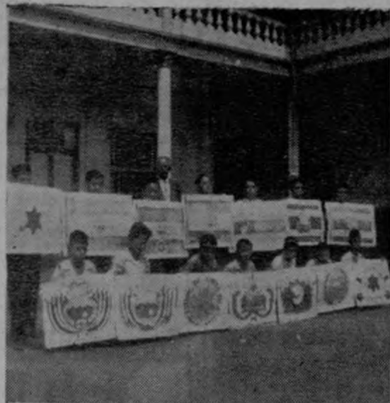
Banderas y Escudos de Costa Rica a través de su historia.— Colegio Los Angeles

Cumpliendo con su deber y en atención a disposiciones del Ministerio de Educación, el Colegio de Los Angeles celebró solemnemente el 138º aniversario de nuestra Independencia, el 15 de setiembre. Mientras la Secundaria de